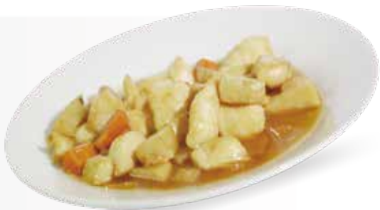
● 109. Pollo alle mandorle € 7,00