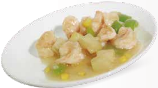
● 106. Gamberetti tre colori € 7,50