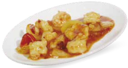
● 105. Gamberetti piccanti € 7,50