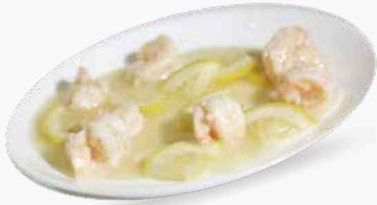
● 107. Gamberetti al limone € 7,50